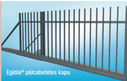
Egidia® pálcabetétes kapu

Az Egidia® kapuk ideális megoldást biztosítanak társasházak, lakóparkok, uszodák, áruházak és ipari telephelyek változatos igényeire is.